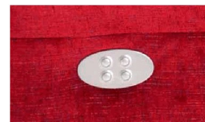
Schaltfläche motorische Verstellung

Mit den vorderen Sensoren wird das Fußteil, mit den hinteren Sensoren die Rückenposition stufenlos aus- oder eingefahren. Die oberen Sensoren zum Ausfahren, die unteren zum Einfahren.