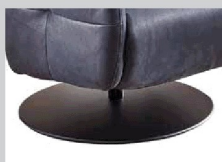
Beispiel Fuß A Metall schwarz Struktur