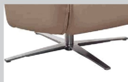
Beispiel Fuß B Metall Edelstahloptik