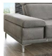
AT fest (Standard)