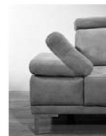
AT Klappbar (Aufpreis)