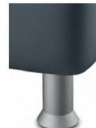
K 01-10 K 01-15 Kunststofffuß alufarbig