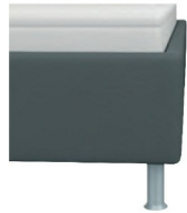
Bettkasten glatt classic Höhe ca. 35cm