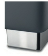
M 09-10 M 09-15 Metallfuß verchromt