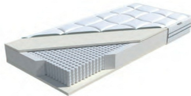
MA 425: Periletto 1000