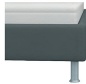
Bettkasten glatt modern Höhe ca. 29cm