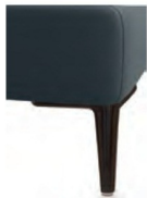
A 11/M01-10 A 11/M01-15 Alufuß schwarz matt