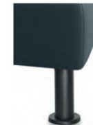
M 24-10 M24-15 Metallfuß schwarz