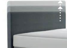
0300 Multimaß Höhe 55 - 125 cm in 5cm-Schritten kürzbar