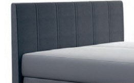
0320 Höhe 115 cm