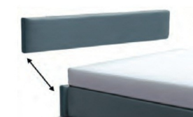
Kopfteilblende 3029 - Höhe 29 cm 3035 - Höhe 35 cm