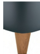
H 25-10 H 25-15 Holzfuß Eiche natur geölt