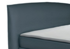
0815 Höhe 118 cm