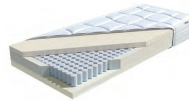
MA 355: Periletto TFK