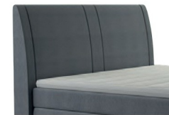
0050 Höhe 117 cm