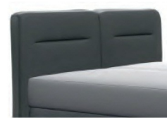
0728 Höhe 119 cm