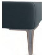
A 11/M12-10 A 11/M12-15 Alufuß gebürstet