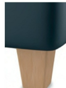
H 17-10 H 17-15 Holzfuß Buche natur lackiert