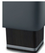
H 05-10 H 05-15 Holzfuß wengefarbig