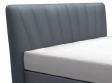
0413 Höhe 127 cm