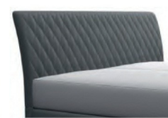
0752 Höhe 117 cm