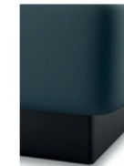
S 01-10 S 09-15 Schwebeloptik mit Sockelblende