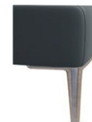
A11/M12-15 Alufuß gebürstet preisgleich