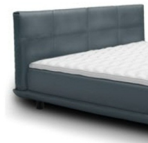
0856 Höhe 75 cm preisgleich