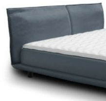
0855 Höhe 75 cm Standard