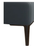
A11/M01-15 Alufuß schwarz matt preisgleich