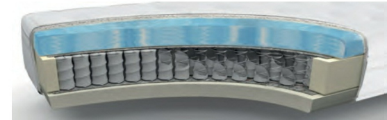
MA235GA gegen Aufpreis