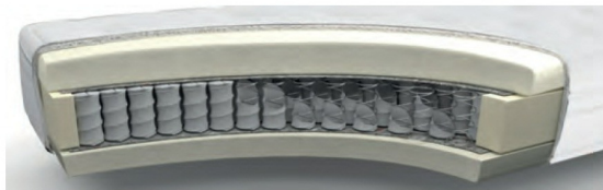
MA235VA gegen Aufpreis