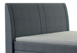
0050 Höhe 117 cm gegen Aufpreis