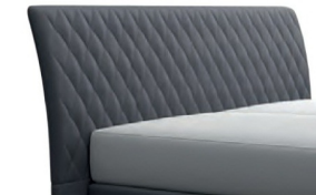
0354 Höhe 116 cm gegen Aufpreis