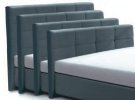
→ 0998S - Höhe 99 cm → 0998M - Höhe 109 cm → 0998L - Höhe 119 cm → 0998XL - Höhe 129 cm gegen Aufpreis