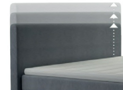
0300 Multimaß Höhe 55 - 125 cm in 5cm-Schritten kürzbar gegen Aufpreis