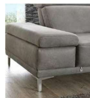
AT fest (Standard)