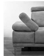
AT klappbar (Aufpreis)